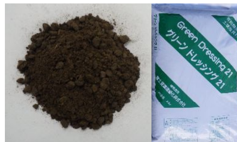
有機肥料(グリーンドレッシング 21)