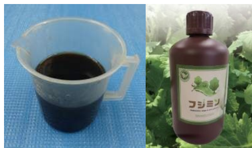
植物活性剤:フルボ酸(フジミン®)